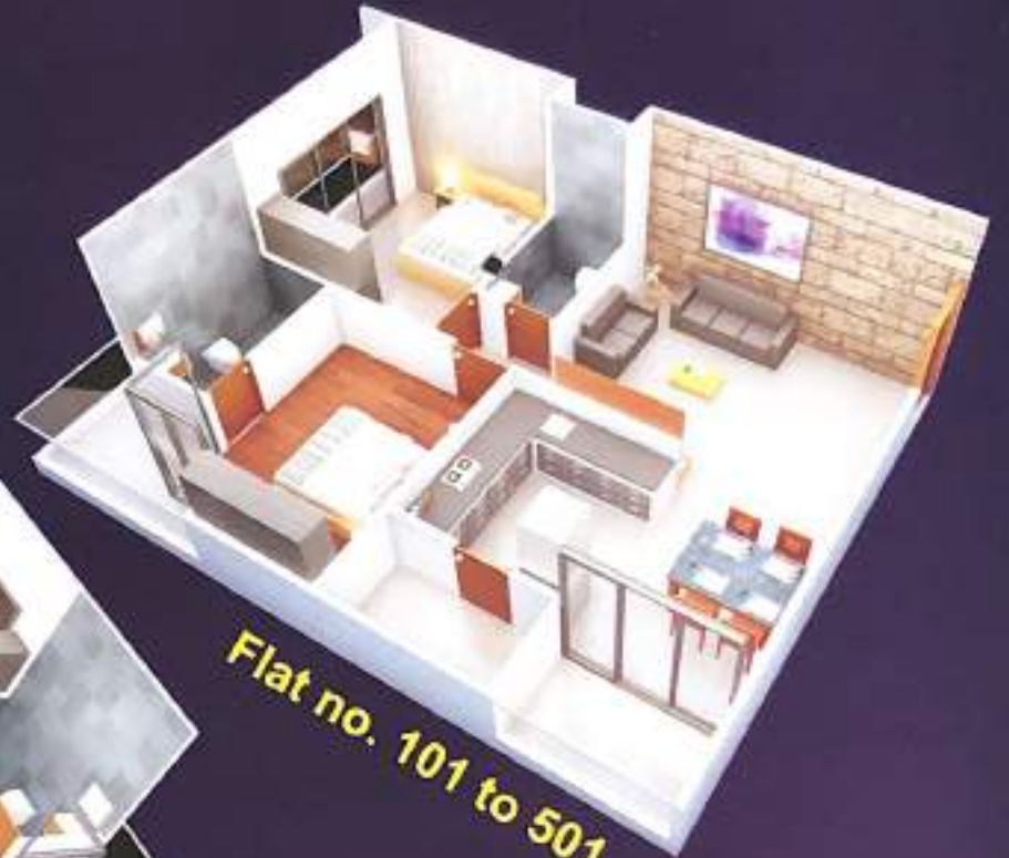
Flat no. 101 to 501