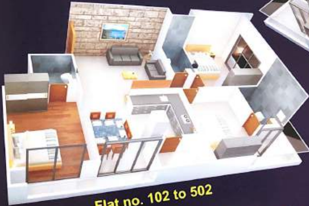
Flat no. 102 to 502